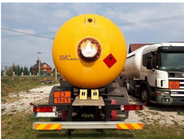
Transporte de butano.

1.3.2.4 La formación debe ser completada periódicamente mediante cursos de reciclaje para tener en cuenta los cambios en la reglamentación.