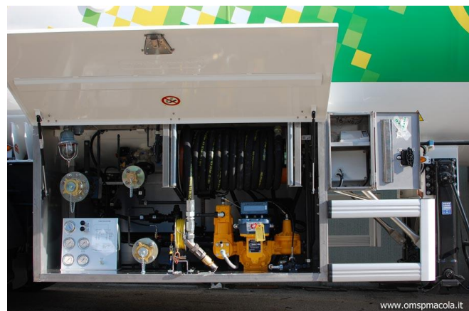
Vehículo cisterna para el transporte de gas.