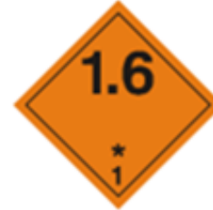
(Modelo de etiqueta n° 1.6) División 1.6

Cifras negras sobre fondo naranja. Deberán medir unos 30 mm de altura y 5 mm de espesor (en etiquetas de 100 mm x 100 mm); cifra 1 en color negro en la esquina inferior.