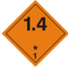
(Modelo de etiqueta n° 1.4) División 1.4

* Indicación del grupo de compatibilidad -se dejará en blanco si las propiedades explosivas constituyen el riesgo subsidiario.