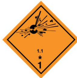
Etiqueta n° 1 División: 1.1

División 1.1 Materias y objetos que presentan un riesgo de explosión en masa (una explosión en masa es una explosión que afecta de manera prácticamente instantánea a casi toda la carga).