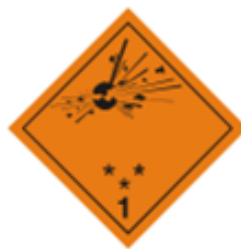
(Modelo de etiqueta nº 1) Divisiones 1.1 1.2 y 1.3

Algunas sustancias pueden convertirse en explosivas debido a cambios químicos en su estructura (auto-oxidación) sin causa alguna aparente. Su transporte, debido a sus características especiales además de estar reguladas por el ADR deben cumplir aspectos relativos al transporte recogidos en el Reglamento de Explosivos.