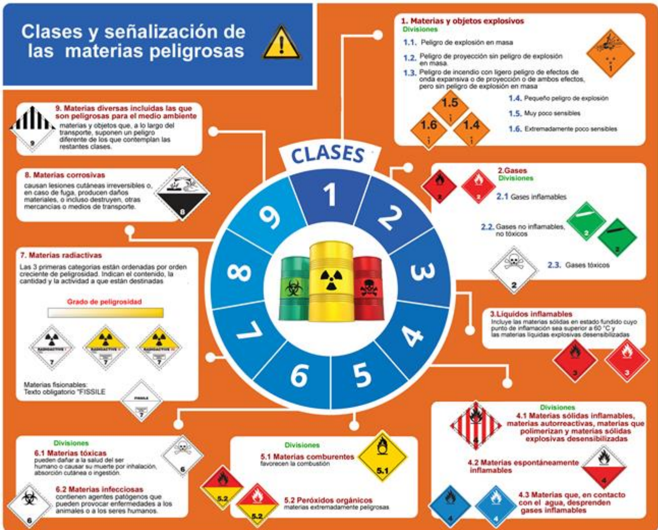
Las 9 clases de sustancias peligrosas según la Reglamentación Modelo